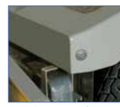
▲クリアランスセンサー