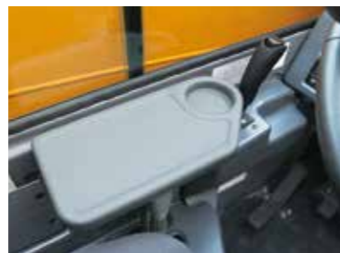
▲ランチテーブル(オプション)