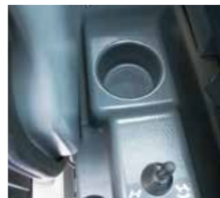
▲ドリンクホルダー