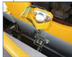
▲ウインチ確認カメラ