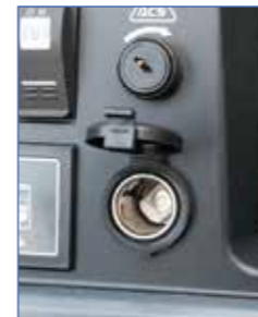
▲アクセサリソケット