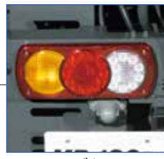
▲LEDコンビネーションランプ