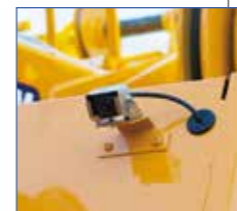
▲左前方確認カメラ