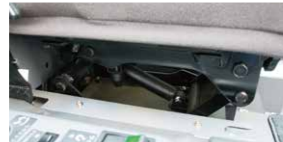
▲新規ファブリック採用サスペンション付シート