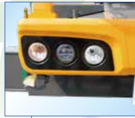
▲LEDヘッドランプHi-Lo切替式