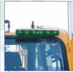
▲ACS外部表示装置(LEDタイプ)