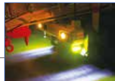
▲LEDサイドマーカーランプアンダーライト付