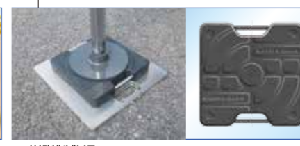
▲樹脂製敷板 (KATOオリジナル)